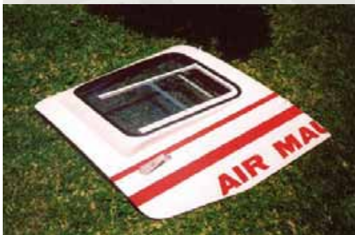
Man kann keine abmontierten Türen schließen.

„Please close the door!“, rief ich, als wir bereits fünf oder sechs Meter in der Luft waren und neben mir noch immer eine Öffnung klaffte. Die deutschen TV-Leute blickten mich ironisch an. „There are no doors“, sagte die sonore Pilotenstimme durch den Kopfhörer, „this is helicopter fotoshooting!“